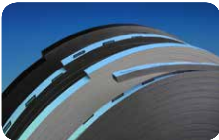
Familia de espaciadores Thermalbond® : V2100, V2200G, V2200, Xpress

Thermalbond® V2200 es un material ESPACIADOR y no debe utilizarse como componente estructural.